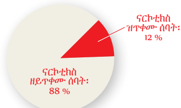
ኣብ ላዕለዋይ ካልኣይ ደረጃ ዝምሃሩ ናይ 2ይ ዓመት ተማሃሮ

ኣብ ዞባ ክሮኖበርግ ዝርከብ ንናርኮቲክስ ዝጥቀሙ ኣዋልድን ኣወዳትን 2018