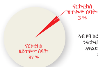
ናይ 8ይ ዓመት ተማሃሮ

ኣብ ክሮኖበርግ (Kronoberg) ኣብ ዝርከቡ ቆልዑን ንኣሸቱ መንእሰያትን ኣተኩሩ ኣብ ጥዕናን ልምድታት ኣነባብራ ሰባትን እተገብረ እዋናዊ ዳህሳሳዊ መሕተት፡ ኣብ ዕድመ ላዕለዋይ ካልኣይ ደረጃ ካብ ዝርከቡ ሓደ ካብ ሰለስተ ኣወዳት ከምኡውን ሓንቲ ካብ ኣርባዕተ ኣዋልድ፡ ድራግ ክፍትኑ ዕድል ከምዝነበሮም ይገልጽ፤ እዚ ድማ ደረጃ ተጠቓምነት ልዑል ከምዚ ኾነ ዘመልከት እዩ። እዚ ድማ ኩሉ ሰብ፡ ካናቢስ ይፍትንዮ ማለት ኣይኮነን። ኣብ ክሮኖበርግ ዝርከቡ መብዛሕኦም ንኣሸቱ መንእሰያት፡ ብፍጹም ኣይገብርዎን እዮም። ንኣሸቱ መንእሰያት፡ ካናቢስ ንክይፍትኑ ካብ ዝገብሮም ሓደ ካብቲ ኣዝዩ ኣገደስቲ ምክንያታት፡ ወለዶም ክፍትንዎ ይክእሉዮም ዝብል ትጽቢት ስለዝህልዎም እዩ። ስለዚ፡ ኣበርክቶ ንክትገብሩ ተራ ኣለኩም!